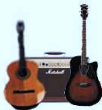
Guitare classique ou électro-acoustique: ampli 30 W micro (de préférence) ou sortie ligne