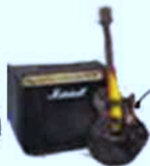
Guitare électrique: ampli 40 W micro (de préférence) ou sortie ligne