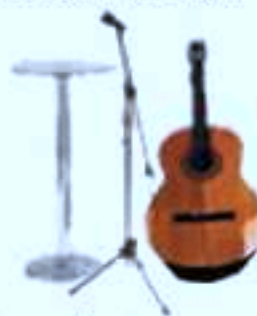
Guitare électro-acoustique: prise directe