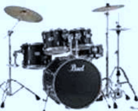
5 micros batterie (2 OH, 1 GC, 1 CC, 1HH)